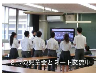
2つの児童会とミーティング交流中

ックを当たり前のように使う姿には、時代の流れの速さと、生徒の飲み込みの速さに感心させられる場面が多いです。1学期には、中野小学校、津久井中央小学校の児童会と本校生徒会が、Googlemeetで交流を行いました。このようなICTの活用は、コロナ禍でことは勿論、コロナ後の世界や生徒の未来を見据えて、学校のシステムと共に進めていきたいと考えています。