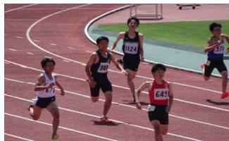
節目の場ー陸上競技

大会となる節目の場が 開催されます。また文 化部では輝翼祭文化部 門での発表等がありま す。また部活動以外で 地域のスポーツや習い 事をしている友達もいます。皆最後まであき らめない「NEVER GIVE UP」の気持ちと試合 等に出ている選手と控えの選手の気持ち・心 を一つにして「チーム」で挑戦して欲しいと 思います。その際には「ありがとう」という