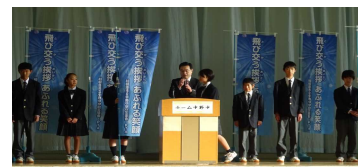
生徒会本部による発表

あいさつ運動のシンボルとして挨拶標語の懸垂幕とのぼり旗が作製され学校内に掲示されました。