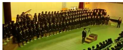
輝翼祭(3年学年合唱)

この学校目標を達成するためには、教職員が理想とする学校の姿を語り合い、共有することが大切であると考えます。教育の夢やロマン・願いを各自が持ち寄り、「こんな学校にしていきたい。こうした力を生徒につけさせ