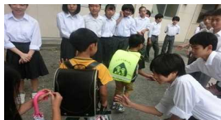
小中合同あいさつ運動

(3)学校を内外に開き、保護者や地域、小学校と連携した教育活動を進める。①学校からの情報発信、外部からの情報受信を積極的に行うとともに、地域の教育力を生かした教育活動を進める。②小学校と連携した9年間の学びと育ちを導く小中一貫教育を進める。